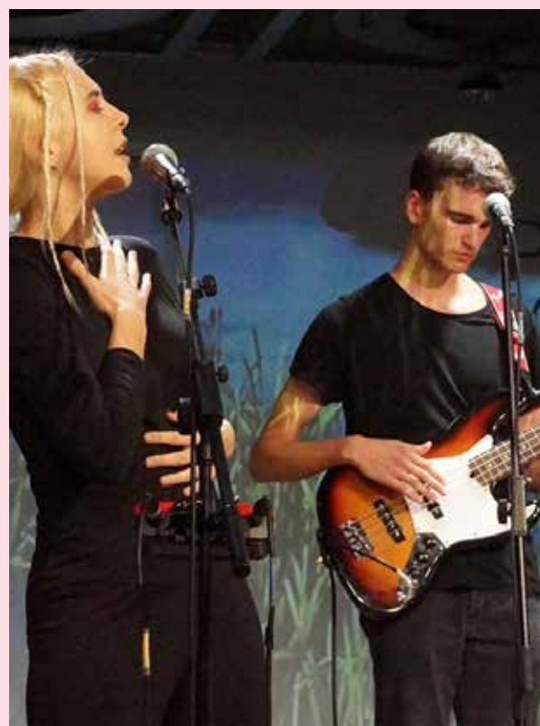
Plutos Baby på Dias Nordicos i Madrid