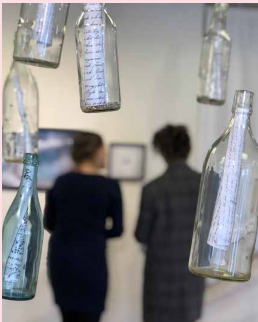
"Oss emellan havet"