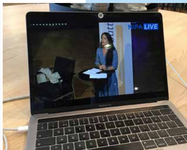
Stream fra seminaret om Hedersförtryck och våld i Norden