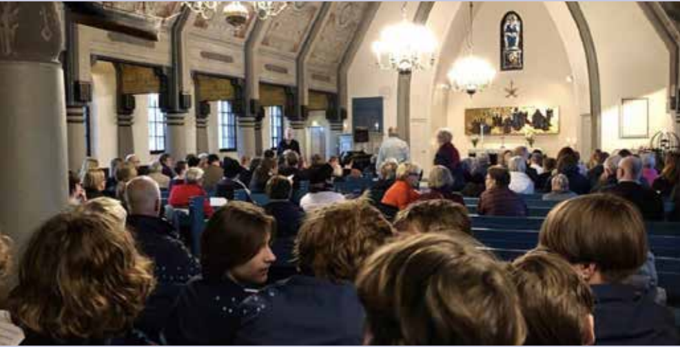
Sankt Annæ junior mandskor i Sankt Görans Kyrka, Mariehamn