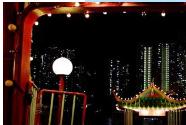
Breaks of Dawn, live musik/video performance på Bio Savoy