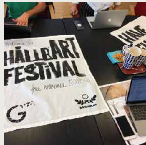
Holdbar plakat production