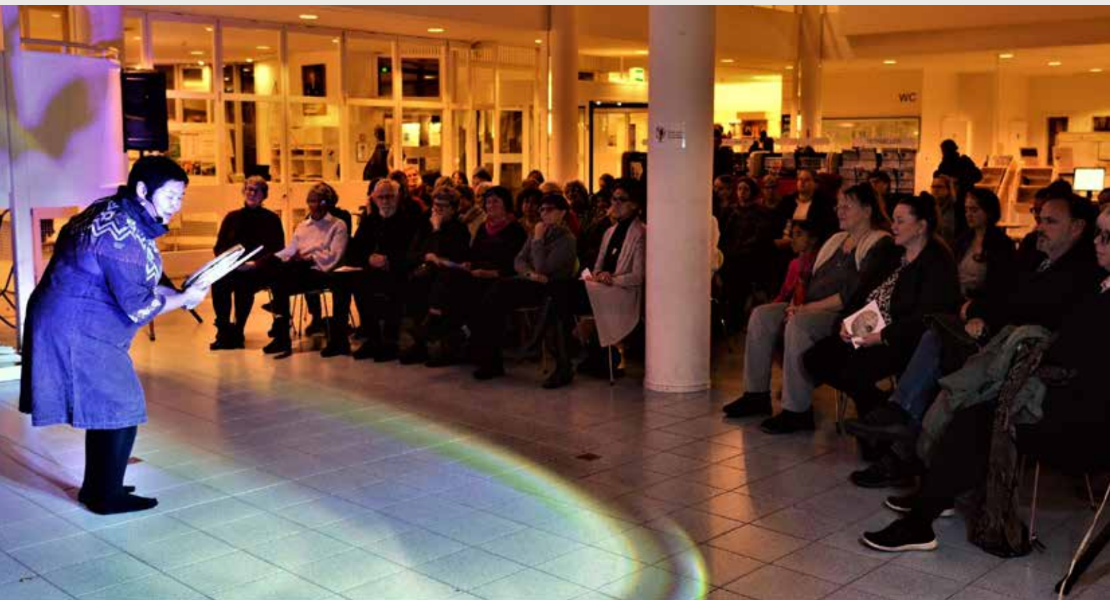
Trommedans på Bibban