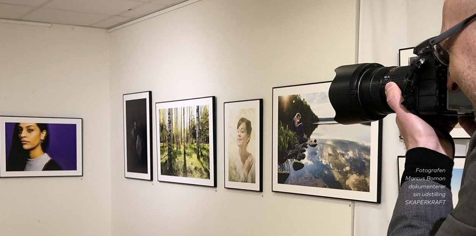
Fotografen Marcus Boman dokumenterer sin udstilling SKAPERKRAFT